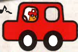
ジェームス オリジナルキャラクター じえいもん